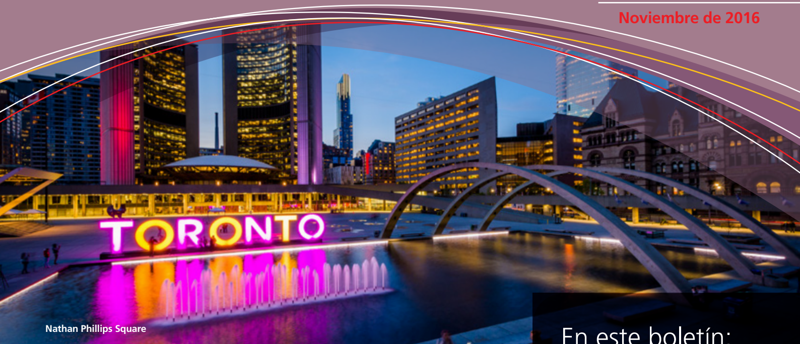
Nathan Phillips Square